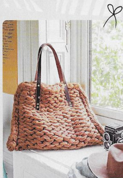
Flax & Twine