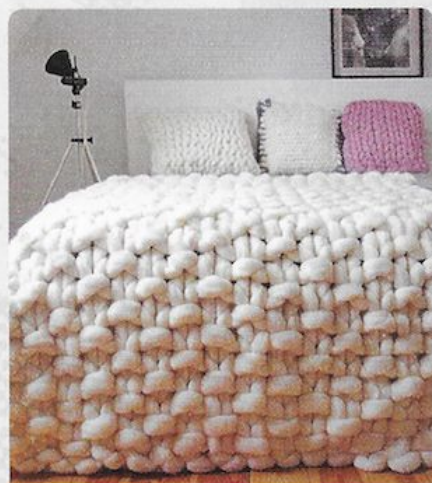
holycrap yarn and stuff. tumblr.com