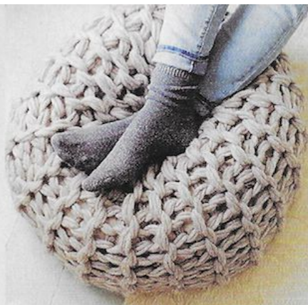
Flax & Twine